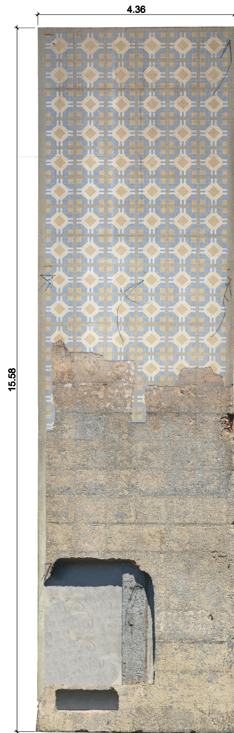
1 ORTOFOTO - PAINEL ESCALA: 1/50